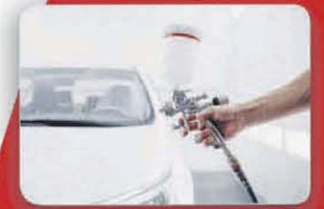
Nuevo servicio de CHAPA y PINTURA