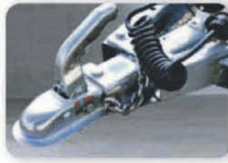
Instalación de enganches para remolques