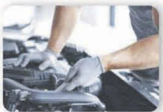
Mecánica integral del motor para vehículos diésel y gasolina