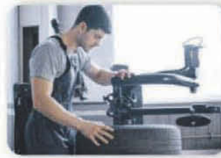
Sustitución de neumáticos y reparación de pinchazos