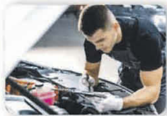
Revisiones cajas de cambio automáticas